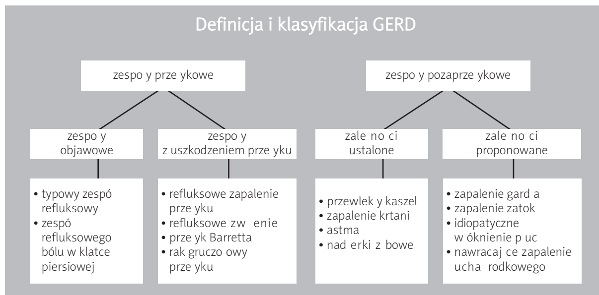
Ryc. 2. Klasyfikacja choroby refluksowej. Według: The overall definition of GERD, and its constituent syndromes (Montreal classification). Am J Gastroenterol 2006; 101: 1900-1920

właściwe wydaje się zastosowanie następujących zasad w ocenie każdego pacjenta z podejrzeniem choroby refluksowej: